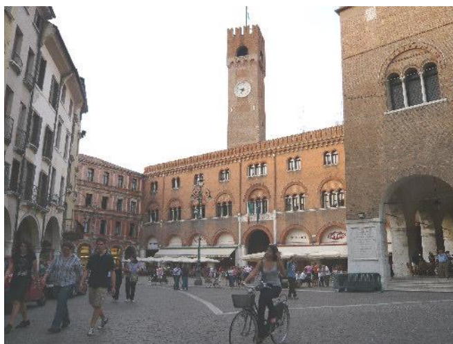
Treviso P.za dei Signori

Partenza 1° Pullman da Venezia Piazzale Roma, ore 8.20, da Viale Vespucci 8.30. Partenza 2° Pullman da Spinea Angolo Via Veronese ore 8.10, da Catene distributore Eni 8.15, da C.so del Popolo 8.20, da Via Forte Marghera (Sede Italgas) 8.25, da Viale Vespucci 8.30. Visita libera alla città di Treviso si riparte alle 12.00 per recarsi al Ristorante " Osteria Sicilia", Via Santi, 50 tel. 0422380111 Dosson di Casier (TV)