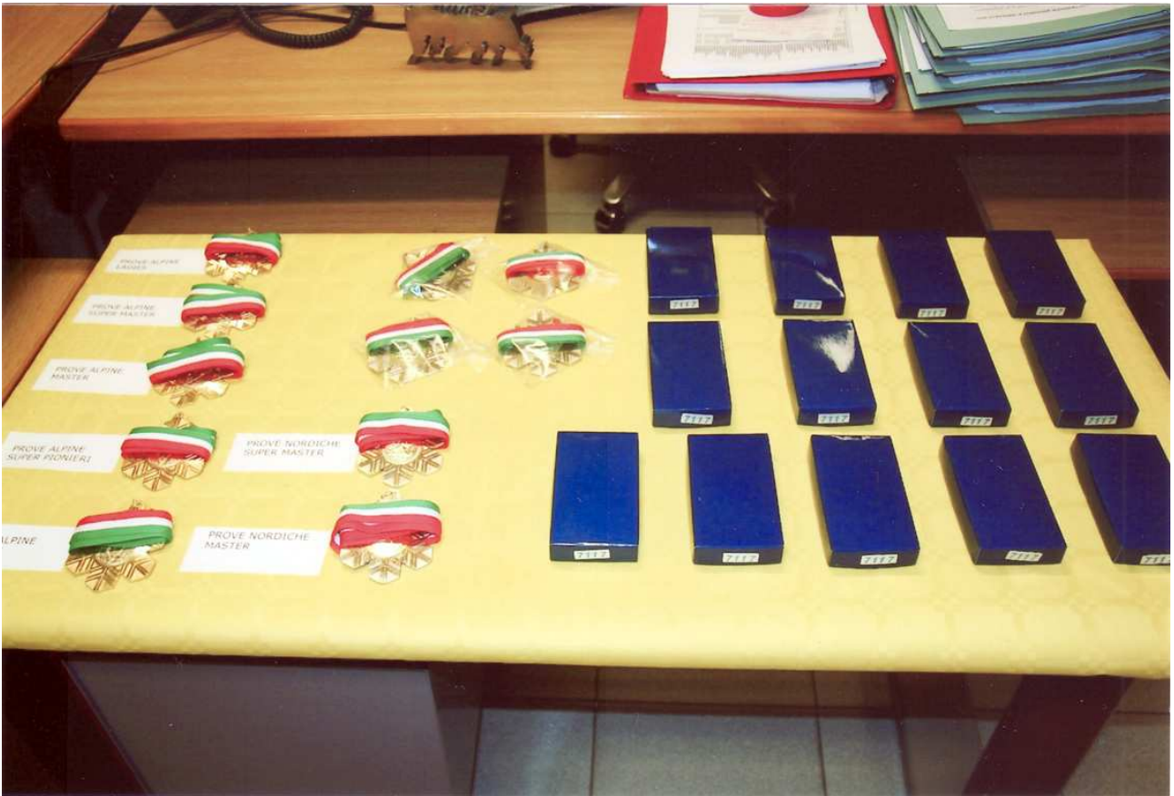
Il tavolo con i premi