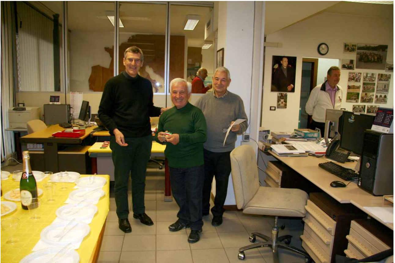
Premiazione del socio Calcina