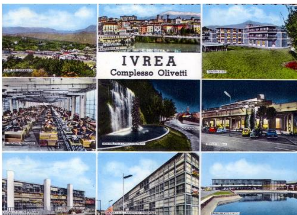
Una vecchia cartolina del 1965

L’Unesco nella prossima sessione di giugno-luglio deciderà se dichiarare “Ivrea, Città industriale del XX Secolo” patrimonio dell’umanità.