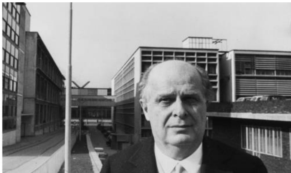
Adriano Olivetti (1901 - 1960) nel 1958

Troppo spesso in Italia dimentichiamo che il modello internazionale di impresa moderna - attenta alla contaminazione dei saperi scientifici e umanistici, ai valori etici e costantemente protesa verso il futuro - è nato alla Olivetti di Ivrea.