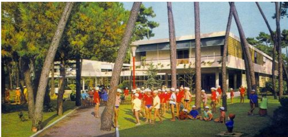
Colonia Olivetti a Marina di Massa (1955 circa)

Il rispetto per i lavoratori e la loro partecipazione alla vita dell'impresa