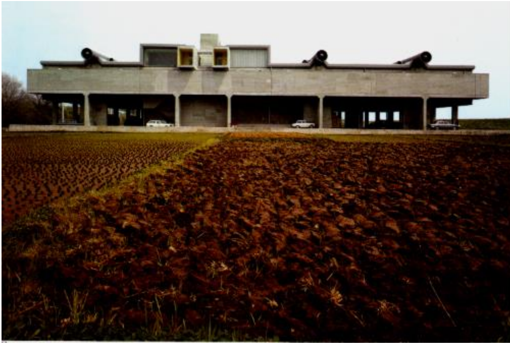
Lo stabilimento Olivetti a Yokohama in Giappone progettato da Kenzo Tange, 1970. L'edificio ospita magazzini, scuole per meccanici, mensa e biblioteca