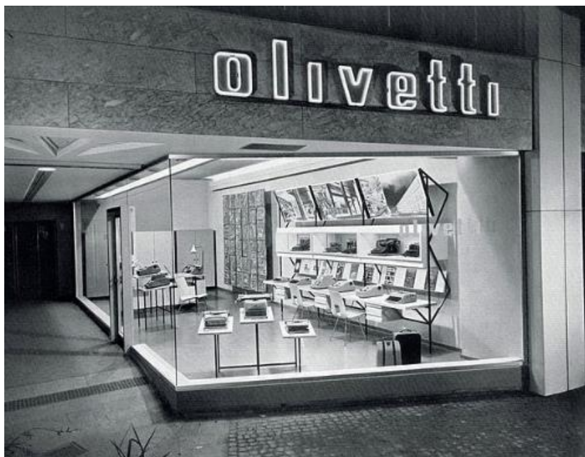
Un negozio monomarca Olivetti nel 1966 circa.