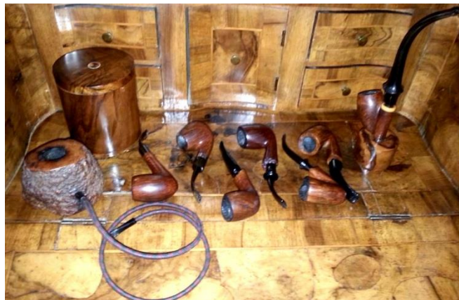
Esempi di pipe finite

Il bocchino è solitamente di ebanite o di altro materiale sintetico